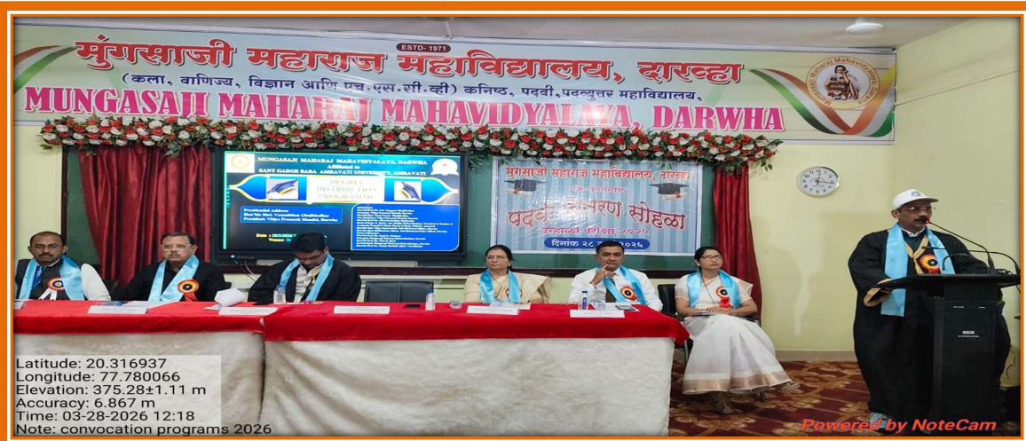
Chief Guest Dr Head of Dept. of Music, Ane Mahila Mahavidyalaya Yavatmal & Member of Academic Council & Music, BOS SGBAU, while expressing his thoughts On 28/3/2026