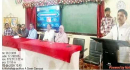
lat: 20.31699 lon: 77.780315 elev: 376.2718102 m acc: 22.55 m me: 02-26-2026 10:43 A Workshop was Held At Green Campus