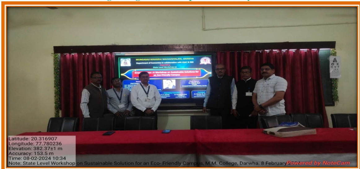
Coordination the workshop on 8 February 2024