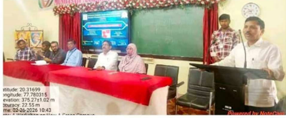
altitude: 20.31699 longitude: 77.780315 elevation: 376.2718102 m accuracy: 22.55 m me: 02-26-2026 10:43