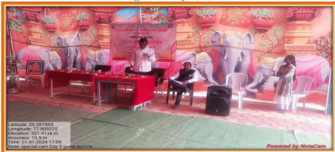
Inaugurating the workshop on 8 February 2024